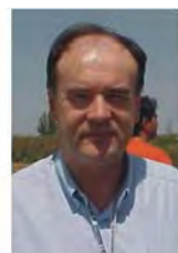
Director de Competición