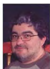
Jefe Servicios Médicos