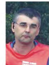
Secretario de Carrera