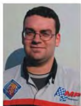
Director de Carrera