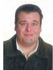
Delegado Técnico RFEA