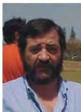
Pte. Comisarios Deportivos