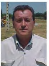
Concursantes