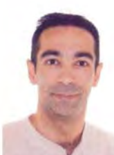
Secretario General de Carrera